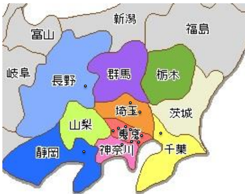
順天堂大学眼科関連施設の分布図( ● 関連施設)