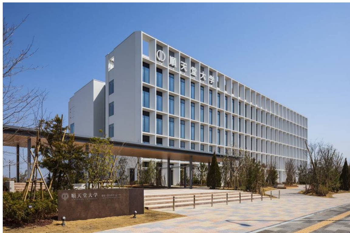
順天堂大学 浦安日の出キャンパス