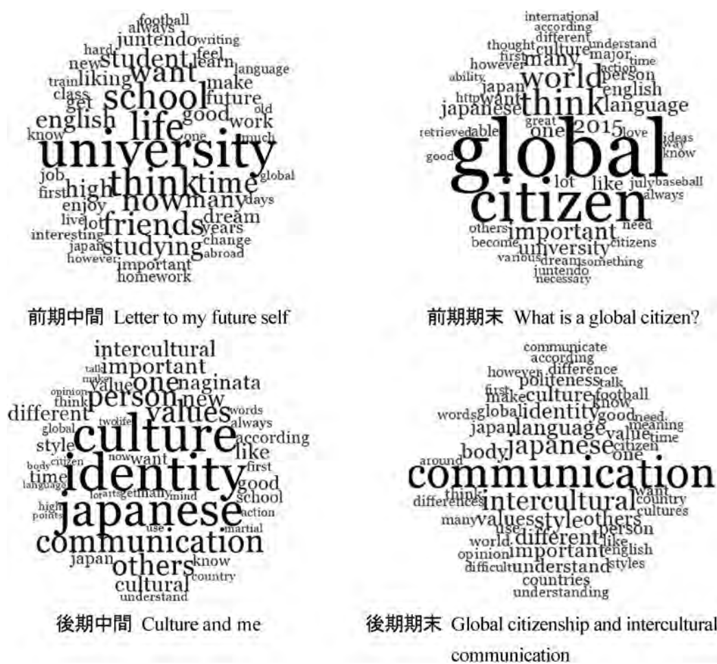
図 2. 主要単語のワードクラウド

理学、教育学分野で行われてきたコーディング作業に変わり、様々な媒体から得た文字情報を管理・構造化・分析する手段として QSR International により開発された質的データ分析ソフト NVivo for Windows (Version 11) を使った。まず、NVivo に前期から収集した作文と録音の書き起こしデータを入力し、エッセイにおける単語使用の移り変わりを観察し、ディスカッションの内容分析を行った。今後、より質的研究手法である談話・会話分析、テキスト分析へ研究を進める予定であるが、本稿では、これまでの分析結果を一部紹介する。