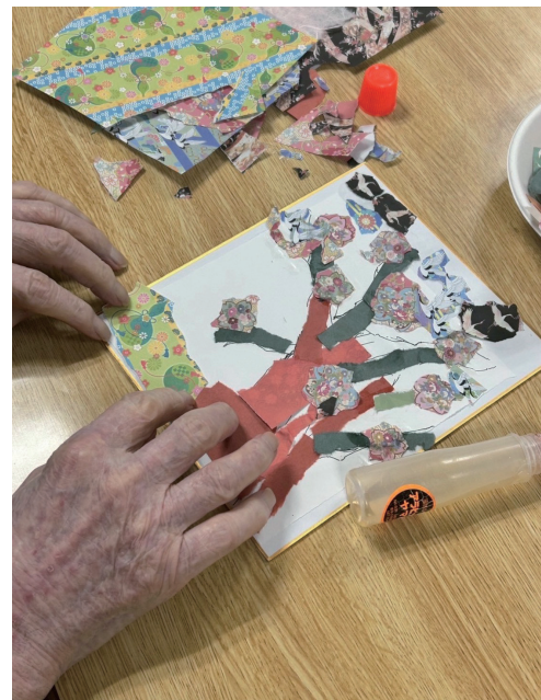
図1. 和アートセラピーの様子