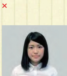
写真サイズが横に長い