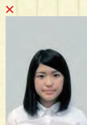
頭上の余白部分が多い