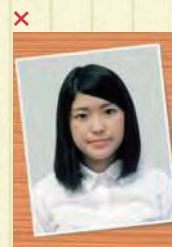
証明写真の再撮影