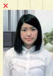
背景に家具等が写っている