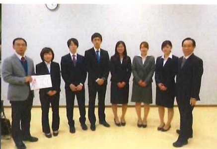
桜順会賞 授賞式（3月11日）