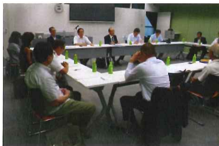
第17回 定例総会（7月4日）