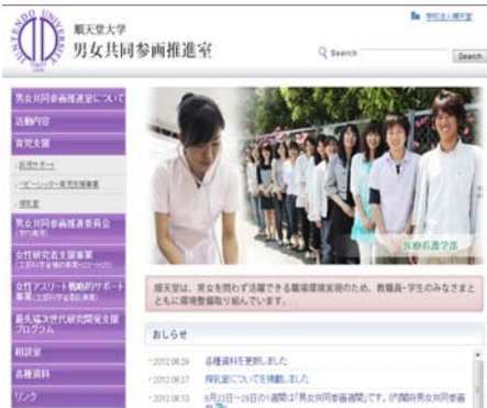
男女共同参画推進室ホームページ開設