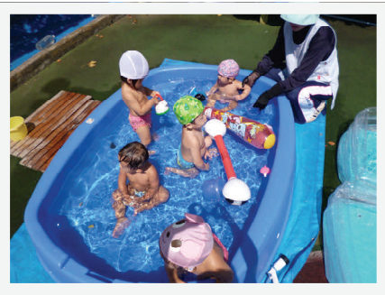
もとまち保育所 プールあそびの様子