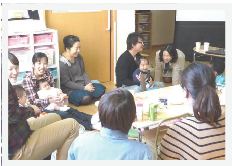
第9回たまごクラブ「子育てママのストレス解消法」の様子

今回の講習会では、前半30分でマッサージの基本動作や注意点を人形を使いながら説明し、後半30分は実際に手技を行います。このとき、講師は赤ちゃんに直接触れません。パパ・ママの手で優しくマッサージ、親子のスキンシップを図りましょう。