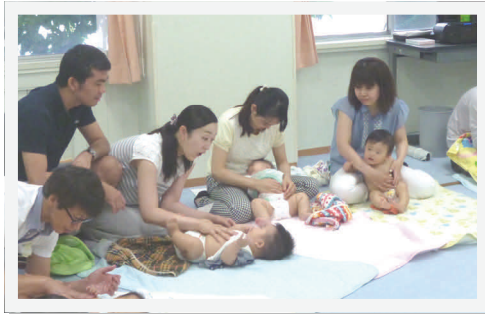
ベビーマッサージをするパパ・ママたち

マッサージ講習会の後は「パパ・ママ交流会」が行われました。育児の悩みや体験談など、さまざまな情報交換がなされ、大変盛り上がりしました。