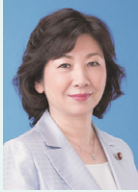
のだ せいこ 野田 聖子