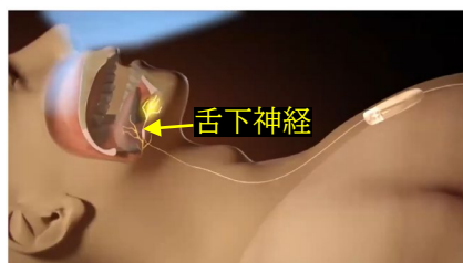
電気刺激がセンサーリードを通して舌下神経を刺激