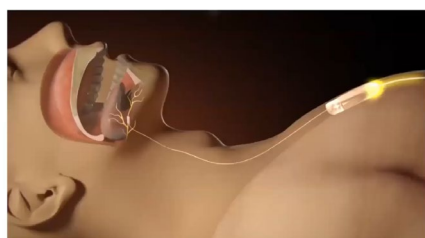
前胸部のパルスジェネレータが呼吸を感知

装置操作：就寝前に外部コントローラーを操作し、スイッチをオンにすると作動します。