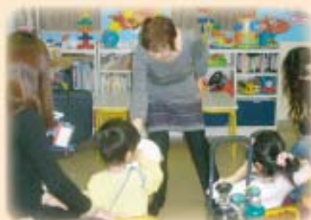
タンバリンを叩いてストレス解消?