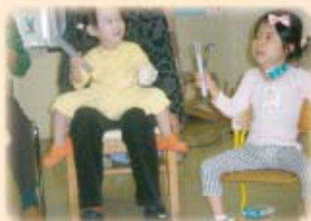
トーンチャイムでハーモニーを楽しもう!!