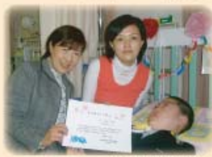
病院で卒業式もできたね!!