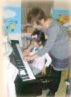
人差し指を出してごらん! 好きな曲が弾けるよ!!