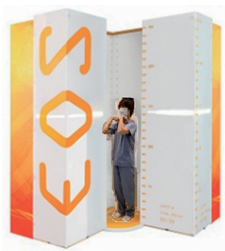
図 1 sterEOS 装置