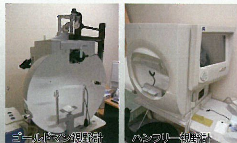
ゴールドマン視野計