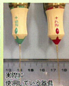
実際に使用している器具