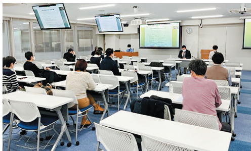
保護者会役員会の様子